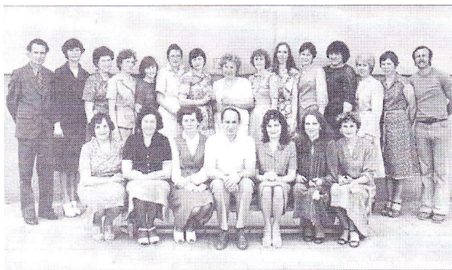
1 pav. 1981/1982 m.m mokyklos mokytojų nuotrauka

Metraštyje teigiama jog tradiciniais renginiais tampa abėcėlės šventė, senelių vakaronė, naujametiniai karnavalai, jaunystės šventė, diskotekos – taigi galime aiškiai matyti kaip pasikeitė tradicijos po 28 metų. 12