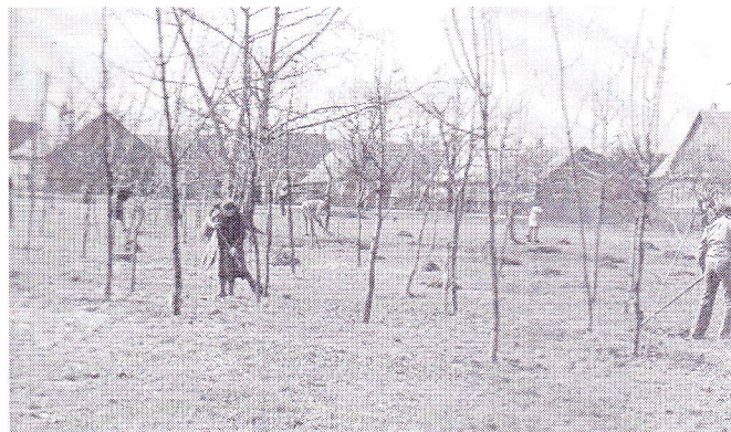
2 pav. Talka R.Čarno gatvės skvere