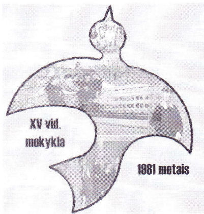
3 pav. Koliažas su geltonu fonu